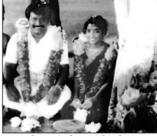
பிரபாகரன் திருமணத்தின் போது

கடந்த முப்பது ஆண்டுகளாக நடந்துவரும் நீண்ட போராட்டத்தில்